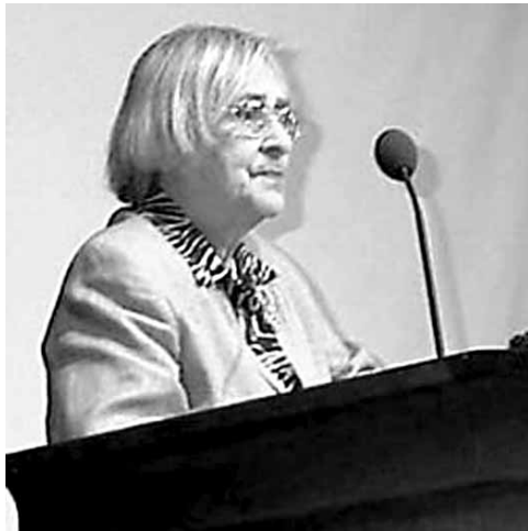
Дамы и господа! Дорогие друзья!