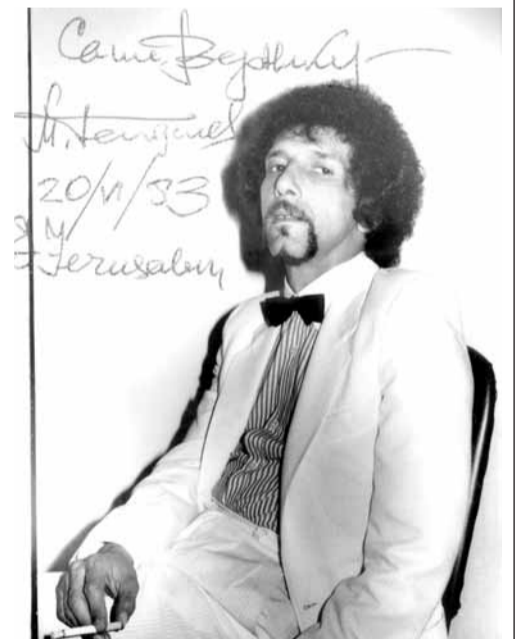
Великолепный костюм цвета сливочного мороженого, 1983

«Никого нет/ у меня в дому/ только заметим вслед/ их нет/ но не потому/ что нет их/ их все нет...»