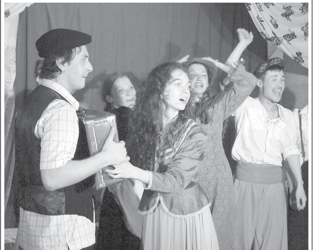
Театр «Дебют». Спектакль «Немец».

Этот год особый — год 150-летия нашего великого классика Шолом-Алейхема. В этот год Кабинет министров Украины учредил премию по культуре им. Шолом-Алейхема, выпущена юбилейная марка, конверт, серебряная монета.